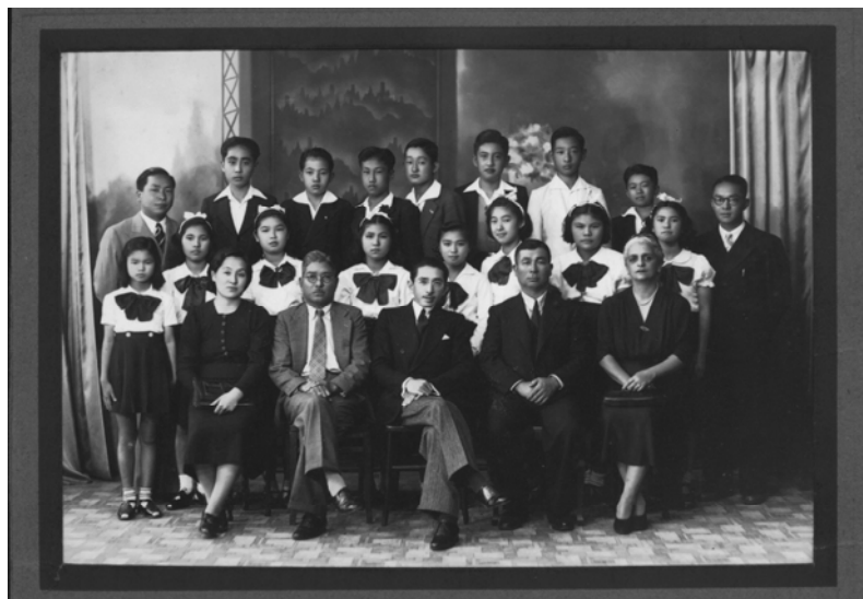
Fig.3 – Grupo de alunos com os professores. (Acervo da Associação Japonesa de Santos).

fazendo horários alternados de aulas de japonês e aulas de ensino primário.