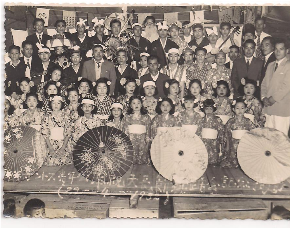
Figura 13 – Festa em comemoração ao aniversário do Imperador com diversas apresentações culturais – dança japonesa, teatro, música com o shamissen – Data 29/04/1932.