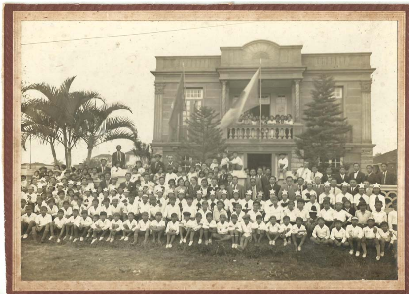
Fig.1 – Fachada da Escola Japonesa de Santos. (Acervo da Associação Japonesa de Santos).

A metodologia aplicada nas aulas de japonês era a mesma que aplicavam no Japão, pois havia professores que eram enviados para a cidade de Santos com a proposta de ministrar aulas e enfatizar a