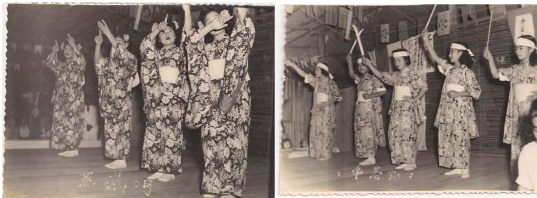
Figura 12- Apresentação de odori – dança japonesa, representada pelas mulheres/meninas. (Acervo da família Koshikene).