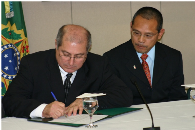
Figura 6 – Assinatura do acordo da reocupação do imóvel. Sadao Nakai e o Ministro do Planejamento Paulo Bernardo.

tempo indeterminado, no ano de 2006, com a assinatura do acordo, como mostra a figura 6.