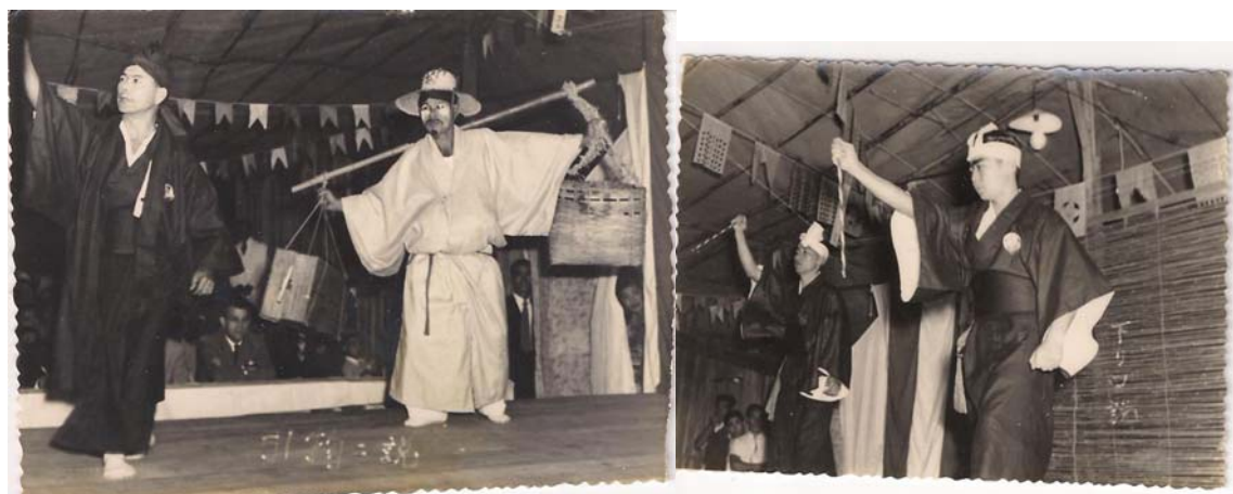
Figura 11- Apresentação de odori – dança japonesa, representada pelos homens/meninos.

No levantamento de dados, as pesquisas foram efetuadas principalmente em arquivos pessoais e relatos de famílias que vivenciaram o período. As referências da cultura japonesa na cidade de Santos acabaram segmentadas durante um período e muito se perdeu de documentações e formas de expressão, pela proibição que fora imposta naquela época. Na Figura 11, algumas das atividades culturais que aconteciam na Escola Japonesa no bairro do Saboó. Essa festividade acontecia todo dia 29 de abril, aniversário do Imperador Hiroito, feriado no Japão.