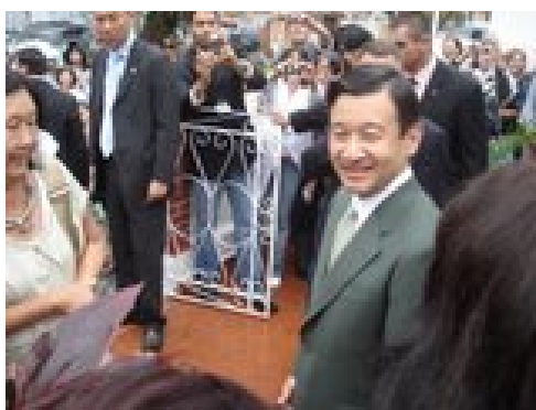
Fig.10 – Visita do Príncipe Naruhito à Associação Japonesa de Santos (2008)