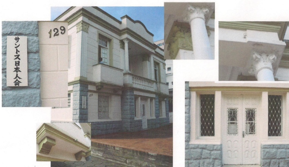
Fig.8 – Detalhes da fachada do imóvel da Associação Japonesa de Santos.