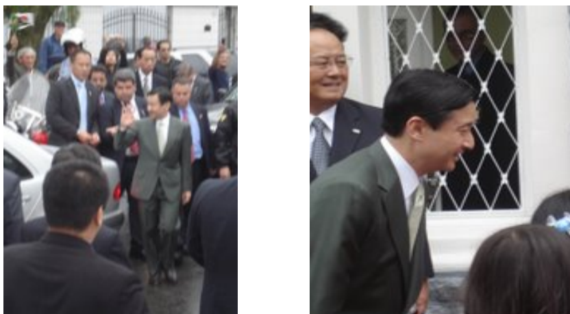
Fig.9 – Visita do Príncipe Naruhito à Associação Japonesa de Santos (2008) – crédito da autora.