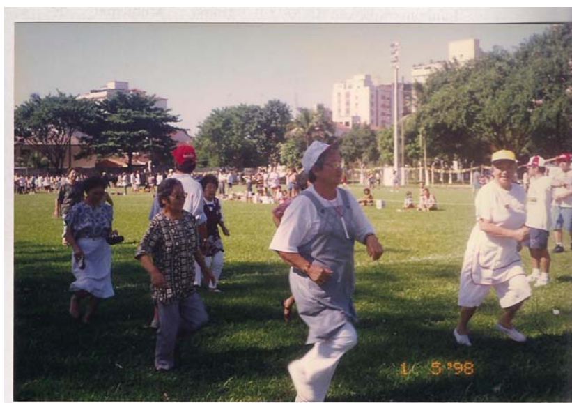
Fig.5 – Undokai (Festa dos Esportes/ 1º. de maio de 1998) – crédito da autora.

Algumas atividades culturais ainda tiveram continuidade, como o Undokai (Festa dos Esportes), Figura 5, e o Keirokai (Festa dos Idosos). A organização acontecia na residência dos presidentes da Associação e os eventos nos clubes da cidade, seguindo a tradição. Segundo Thompson: “Com a transmissão dessas técnicas particulares, dá-se igualmente a transmissão de experiências sociais ou da sabedoria comum da coletividade.” [...] “As tradições se perpetuam em grande parte mediante a transmissão oral”. Entendendo, seja costume, tradição ou transmissão de experiências sociais, algumas atividades e alguns ensinamentos da cultura japonesa, continuaram a ser transmitidas e repetidas conforme o interesse de um grupo em realizá-lo.