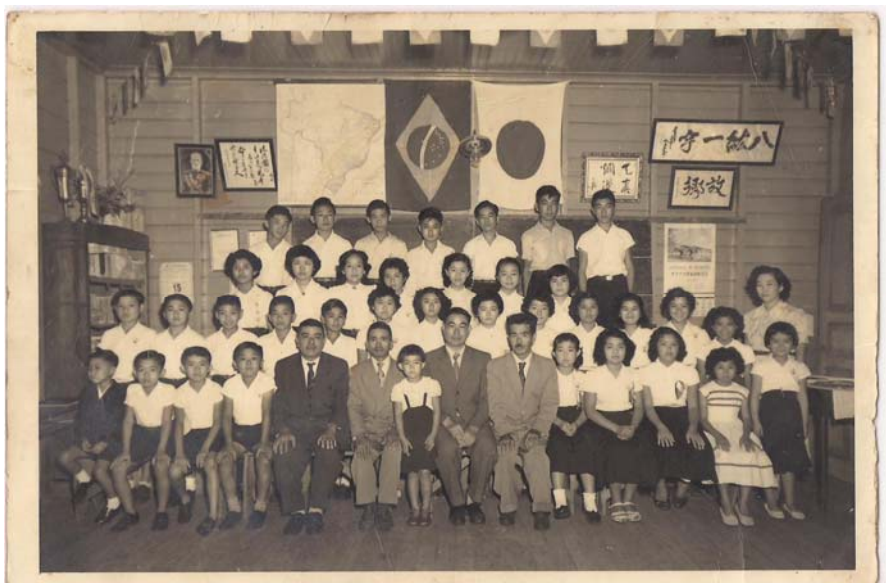
Figura 14 – Alunos e professores da Escola Japonesa do Saboó e alguns alunos do bairro do Mercado. (Acervo da família Koshikene).

Há que se admitir que embora a cultura japonesa esteja atualmente mais difundida entre os brasileiros, ainda há muito a ser feito para se