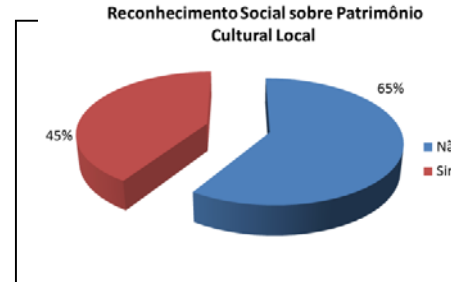
Figura 9 – Bairro Boa Vista