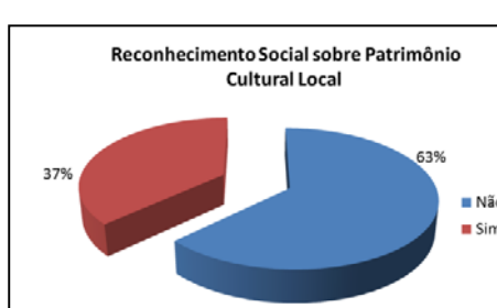
Figura 7 – Bairro Parque Bitaru