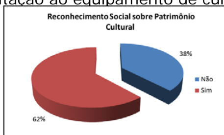
Figura 4 – Bairro Centro

identificar a habitualidade de visitação ao equipamento de cultura.