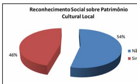
Figura 5 – Bairro Centro