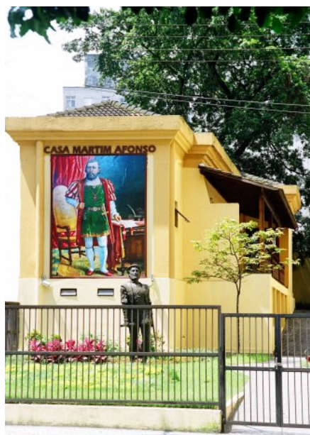
Figura 1 - Casa Martim Afonso

Baseado nesses princípios, o presente trabalho almeja identificar o nível de conhecimento sobre o espaço Cultural Casa Martim Afonso pelos moradores de São Vicente, e se existem dificuldades que possam impedir o sentimento de pertencimento e a memória local. Para tal, apropriou-se dos resultados da pesquisa para sugerir um processo de ações educativas que envolvam a comunidade envoltória, visando aproximação, valorização e divulgação do Patrimônio Cultural, contribuindo assim, para a sua preservação.