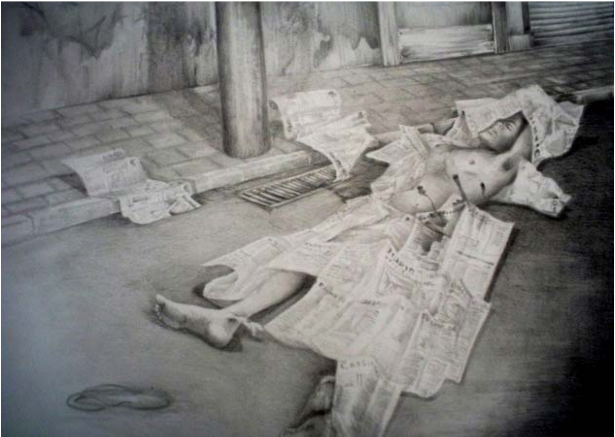
Fig 3 - Título: Hermes. Autor: Joyce Farias de Oliveira. Técnica: Desenho.