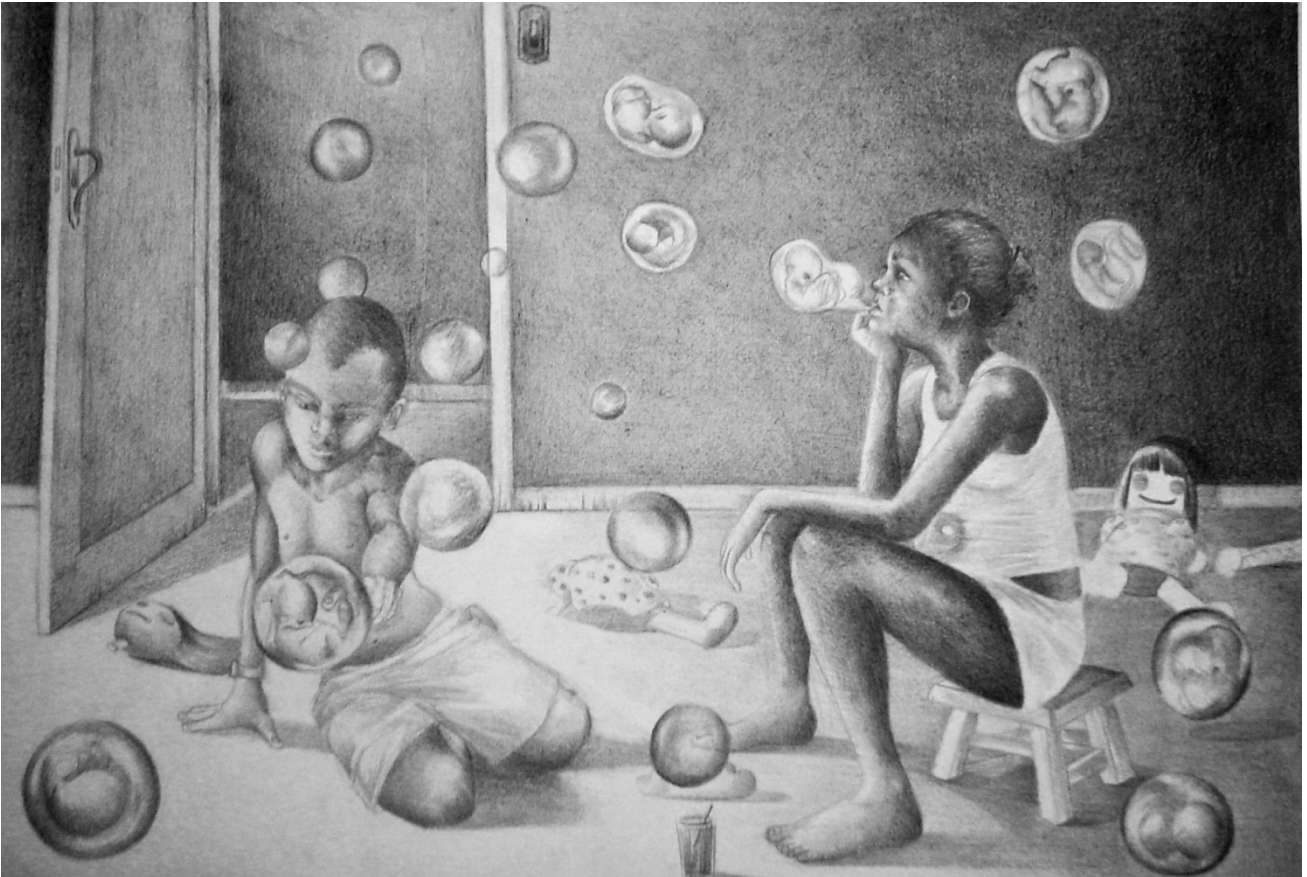
Fig 1 - Título: Cronos e Réia. Autor: Joyce Farias de Oliveira. Técnica: Desenho.