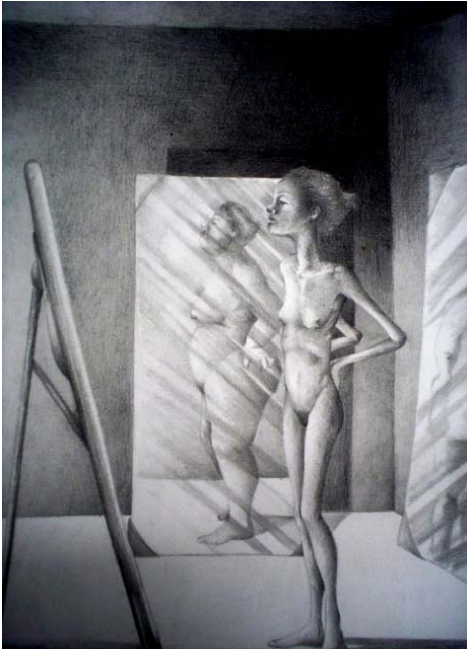
Fig 2 - Título: Afrodite. Autor: Joyce Farias de Oliveira. Técnica: Desenho.