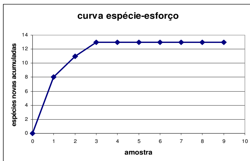
Figura 3: Estudo inicial para investigar o início da estabilização da amostragem