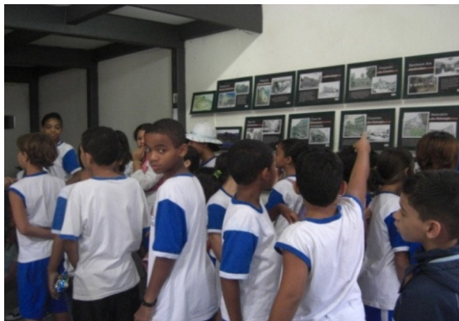
Figura: Alunos realizam estudo do meio no Centro Histórico.

Nesse contexto, a Educação Patrimonial configura-se como uma proposta reveladora de um trabalho comprometido com a construção do conhecimento crítico e do patrimônio cultural.