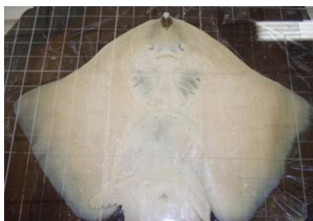
Figura1: placa de acrílico sobre-posta a área ventral da raia

sexo, e construídos gráficos de dispersão para analisar as relações entre as duas variáveis.