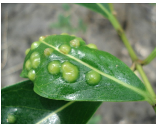
Fig. 1: Galha Foliar em A. schaueriana

Conforme pode ser visto na figura 2, galhas são distribuídas em toda a área foliar nas seguintes proporções: 45,26% concentram-se no ápice foliar, 44,23% na parte medial e 10,49% na parte basal.