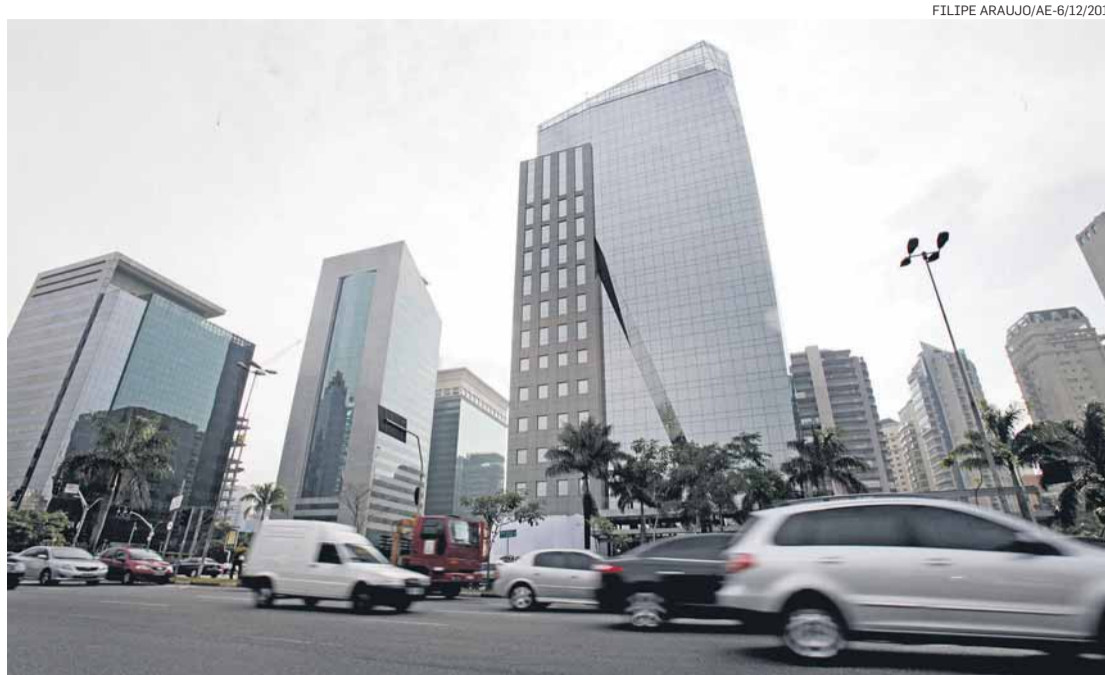
Obras à vista. Para integrante do conselho gestor, impacto da medida pode ser 'irreversível'

O governo municipal informou ontem que "tem total condi-