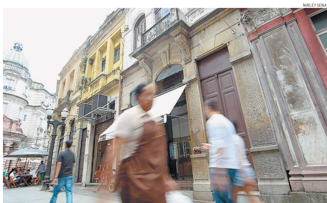
Parte histórica do Centro é uma das regiões que receberão novos aparelhos: ali, serão dez câmeras a mais

ajudar no policiamento. Outra tarefa será prestar orientações para turistas.