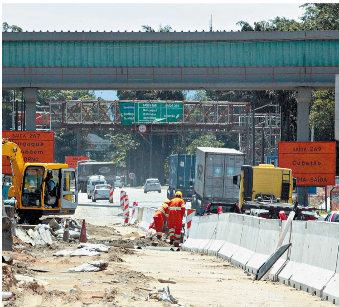
Além do anel viário, empreendimento inclui ainda a abertura de vias marginais de oito quilômetros