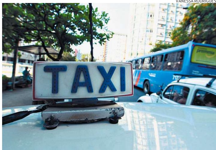
Gasto com aferição do taxímetro para o novo preço chega a R$ 150,00