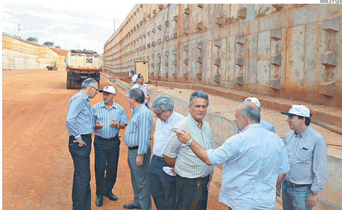
Empresários da Baixada Santista conhecem as obras do Contorno Norte: soluções para facilitar o trânsito

Barros credita ao Codem os avanços obtidos por Maringá, lembrando que o conselho, com representantes da sociedade,