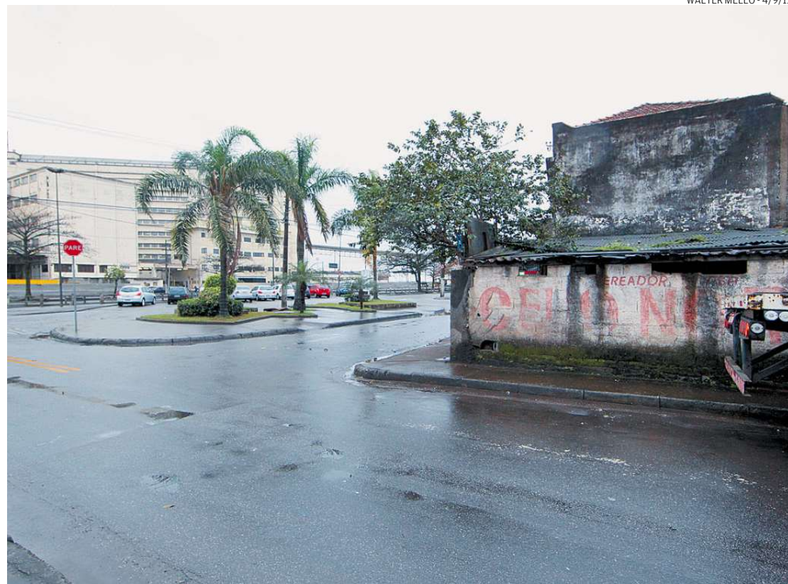
Moradores do Macuco e do Estuário motivaram uma das reuniões para se discutir o empreendimento

Quem tiver interesse em ver os documentos técnicos pode consultá-los, até o dia 13, no Centro de Convivência Praça Viriato Corrêa da Costa (Avenida Bartolomeu de Gusmão com a Avenida Conselheiro Nébias, Boqueirão, Santos); na Prefeitura Municipal de Guarujá