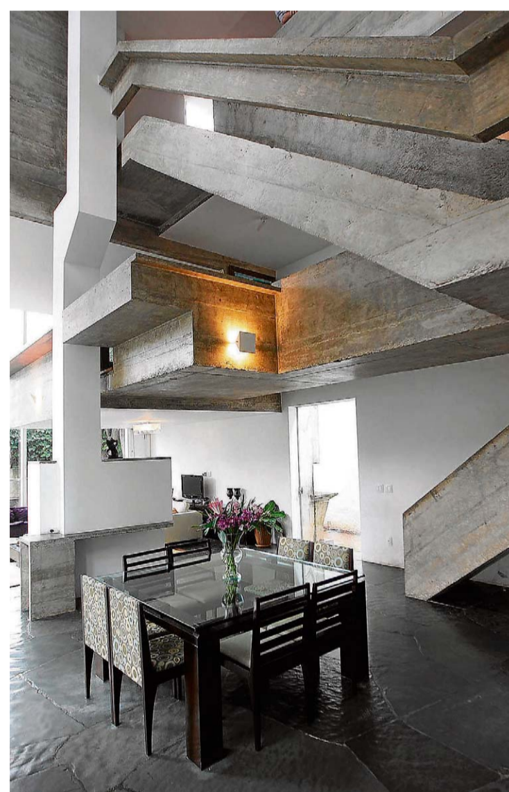
Mix. Estruturas de concreto compõe o ambiente doméstico