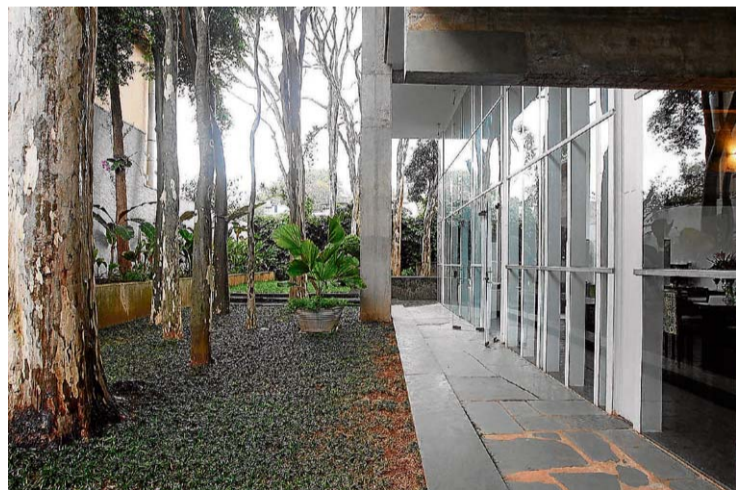
Verde. Árvores podem ser vistas da sala pelos moradores

Ela lamenta ter de deixar o imóvel e só venderá a propriedade porque vai se mudar para o exterior. Mas não abrirá mão do que tem por pouco: a casa está no mercado por R$ 7 milhões ( www.axpe.com.br ). “Temos muito carinho por esse lugar.”