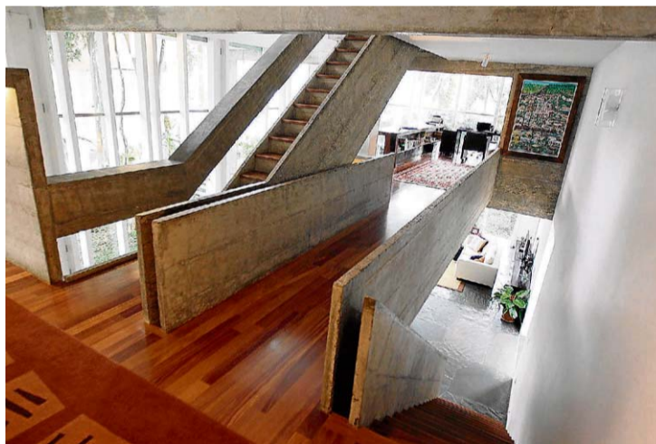
Quente. Piso de madeira cria clima aconchegante no imóvel