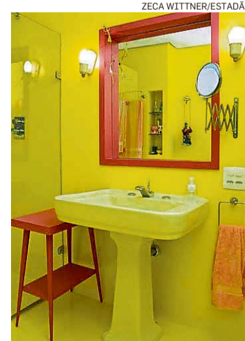
Banheiro. Todo amarelo

moradia em Higienópolis ou na Vila Madalena e imagina que pessoas com senso e interesse estético possam se interessar pelo imóvel. “Aqui tem muitos designers, editores de revistas”, diz. A unidade está sendo vendida por R$ 1,68 milhão e, a uma semana no mercado, já recebeu duas propostas. A cota de condomínio por lá é de R$ 1.280 (informações: www.grazielladosimoveis.com.br ),/e.c.