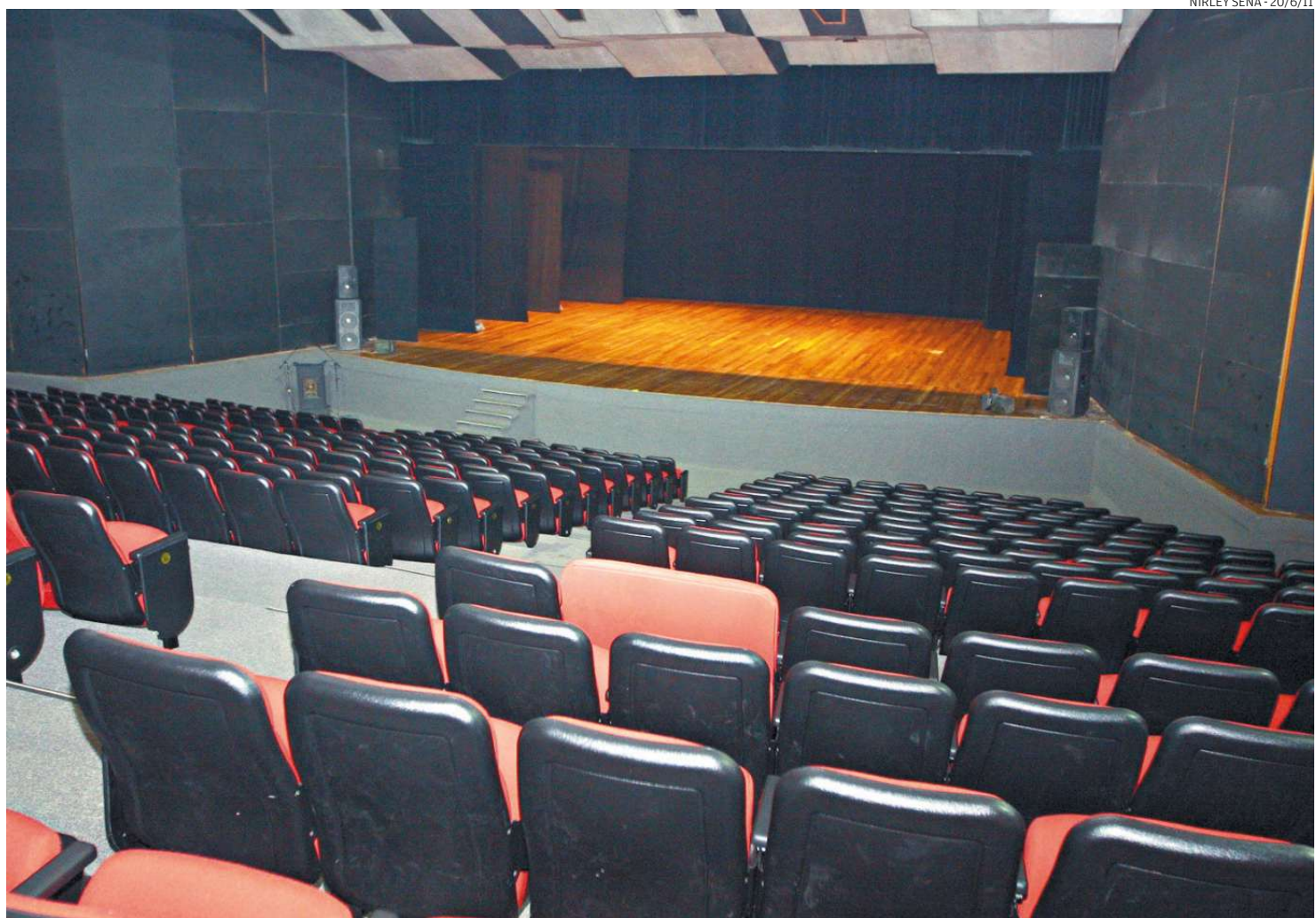
São três os conjuntos de aparelhos responsáveis por climatizar todo o complexo cultural, mas, devido uma pane, nenhum está funcionando