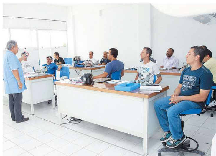
Ideia é profissionalizar as equipes para se evitar novas fatalidades