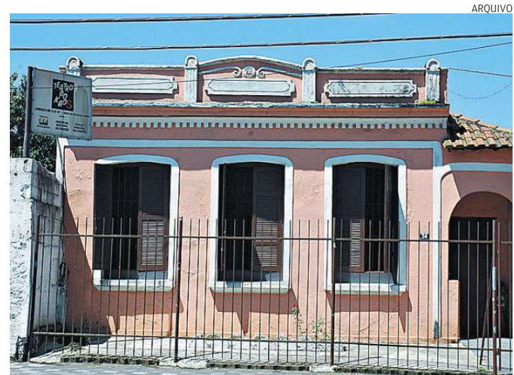
A companhia usa imóvel cedido pela Prefeitura, no Largo do Sapo

Em 2001, a Prefeitura autorizou o uso do imóvel na Praça Coronel Joaquim Montenegro, no conjunto arquitetônico conhecido como Largo do Sapo. O Teatro do Kaos é cadastrado, ainda, no Programa de Ação Cultural do Estado de São Paulo (ProAC).