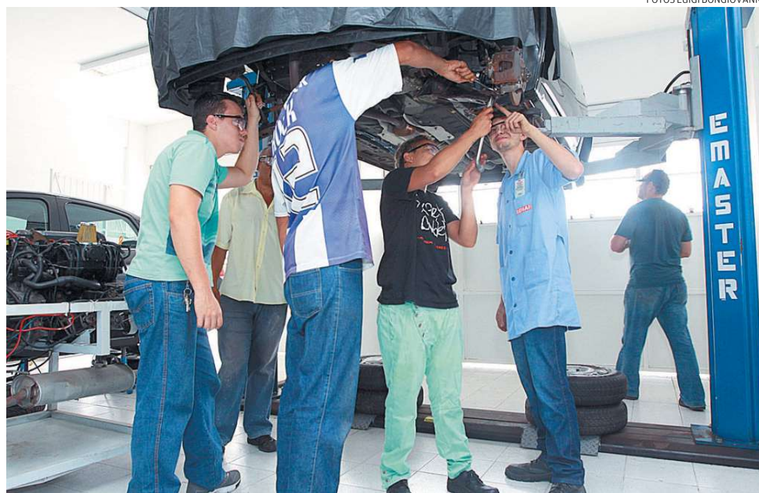
Membros das escolas de samba já fazem aulas de mecânica de automóvel, no Centro Cultural da ZN

Também no próximo mês, devem ser iniciadas as reuniões da comissão municipal que regulamentará a festividade de 2014. “Discutiremos um sistema de controle e seguran-