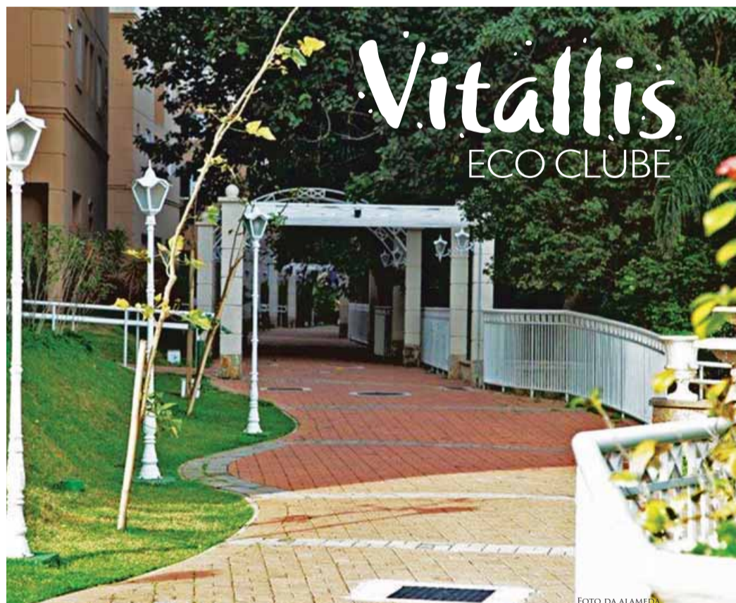
FOTO DA ALAMEDA