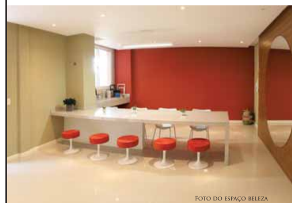
FOTO DO ESPAÇO BELEZA