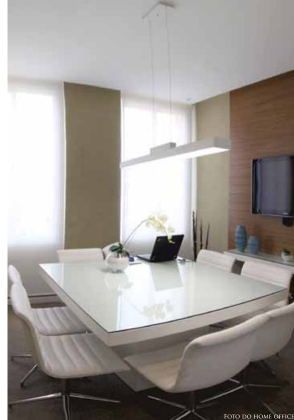
FOTO DO HOME OFFICE

APARTAMENTOS PRONTOS E EM CONSTRUÇÃO, AMPLAMENTE FINANCIADOS.