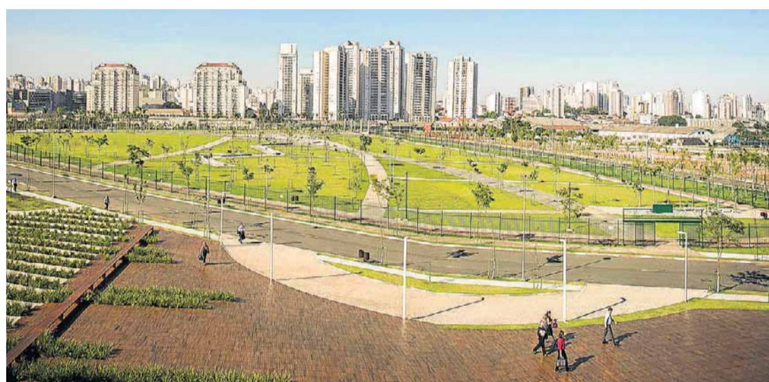
Jardim das Perdizes. Previsão de 30 torres, cinco delas comerciais, e VGV de R$ 5 bilhões

É a área bruta locável do shopping center que o grupo Bueno Netto planeja construir na terceira fase do Parque Global, que também terá hotel, torres residenciais e comerciais