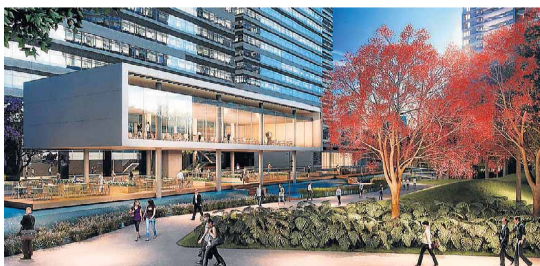
Parque da Cidade. Hotel, shopping, torres comerciais e residenciais, com VGV de R$ 4 bilhões

tos, de 133 m 2 a 317 m 2 , custam de R$ 1,5 milhão a R$ 4 milhões.