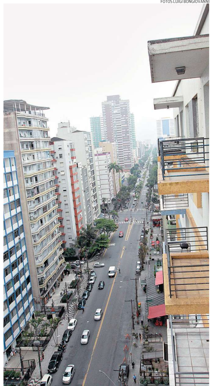
Na Avenida Conselheiro Nébias, negócios e lazer caminham juntos