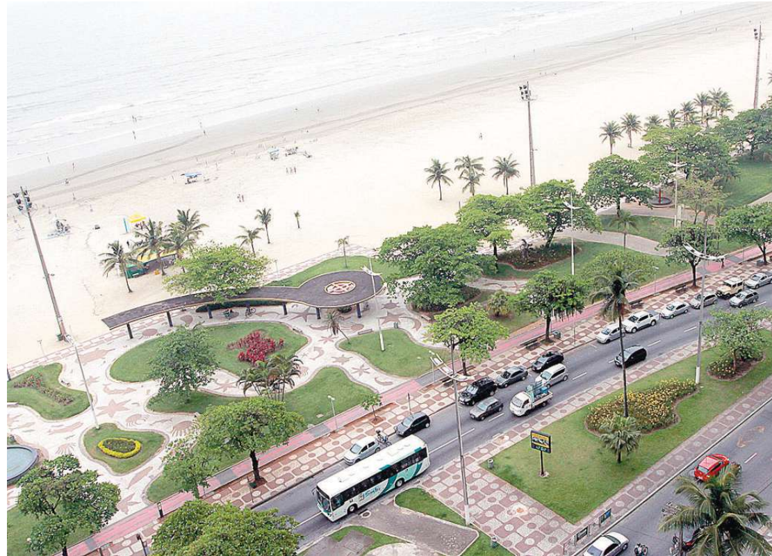
É nesta praça no calçadão que, aos sábados e feriados, é montada a Feirart, feirinha de rua de artesanato

“É a única das 120 lojas que se mantém desde sua inaugura-