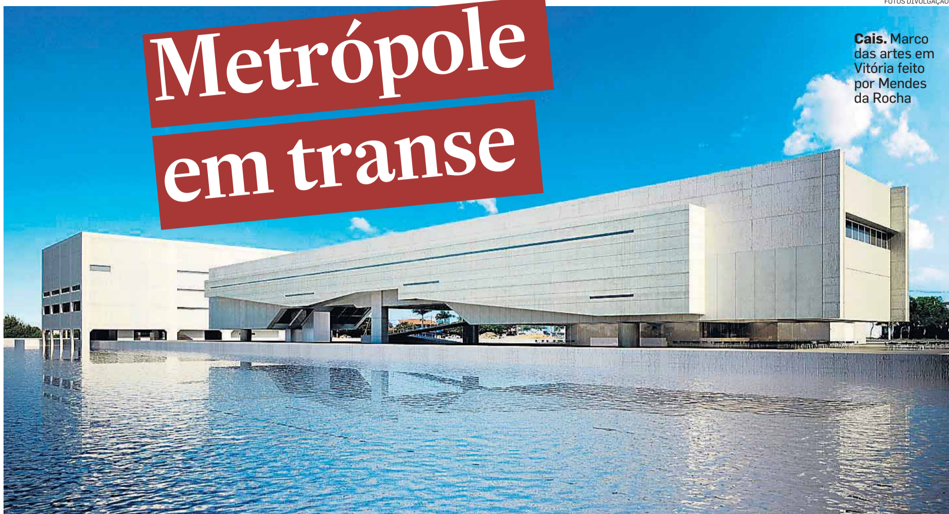
Cais. Marco das artes em Vitória feito por Mendes da Rocha

O livro dedicado pelo italiano Daniele Pisani trata especialmente da capacidade de Paulo Mendes da Rocha de dar nova cara e uso a prédios antigos como o do Museu Nacional de Estado e o Museu Nacional de Belas Artes. Sua ligação com a cultura, aliás, fez com que ele aceitasse o desafio de projetar o Cais das Artes em Vitória ( foto acima ),