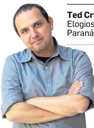
Ted Cruz. Elogios ao Paraná

No caminho de um lado a outro de uma fronteira, no processo de reconstrução e adaptação,