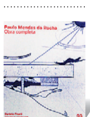
PAULO MENDES DA ROCHA – OBRA COMPLETA

Autor: Daniele Pisani Tradução: Alexandre Salvaterra Editores: GG Brasil (400 págs., R$ 250)