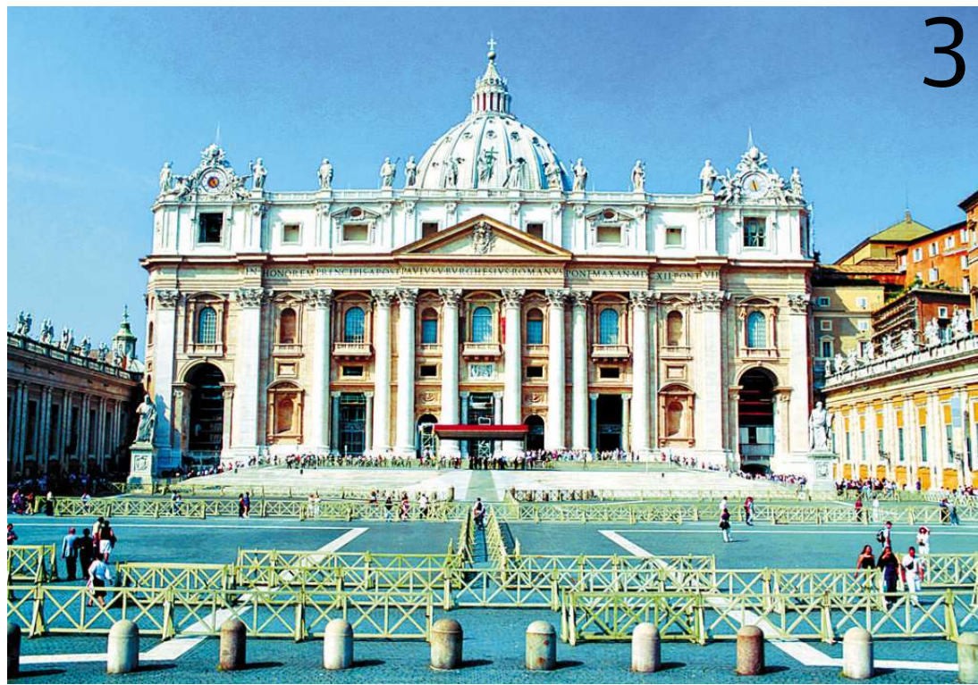
-1- Com sua famosa cúpula, Pantheon é uma das obras do Império Romano -2- Piazza di Spagna, uma das mais populares de Roma -3- Basílica de São Pedro, o reduto de fiéis católicos