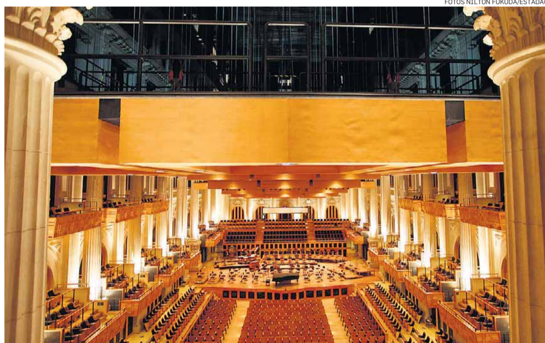
Espect culo. Sala de concertos tem sistema de forros m veis para melhorar ac stica

O pr dio da Esta o J lio Prestes foi constru do entre 1926 e 1938, para ser sede da Es-