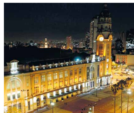
Arquitetura. Esta o   cart o-postal

trada de Ferro Sorocabana, empresa criada pelos “bar es do caf ” paulistas.