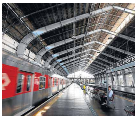
Nos trilhos. Espa o recebe trens da CPTM