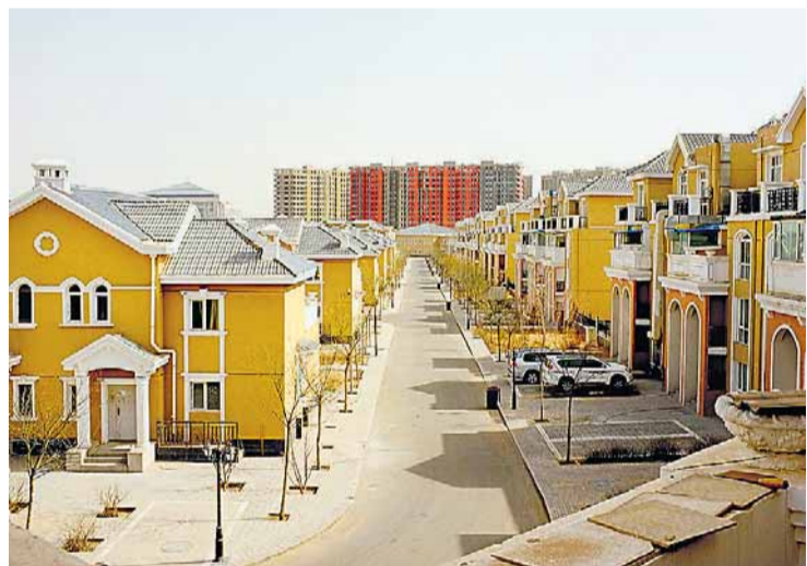
Clone. Distrito-fantasma em Ordos, Mongólia: cópia ocidental