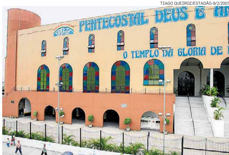
Igrejas. Inscrições eram liberadas em fachadas de templos