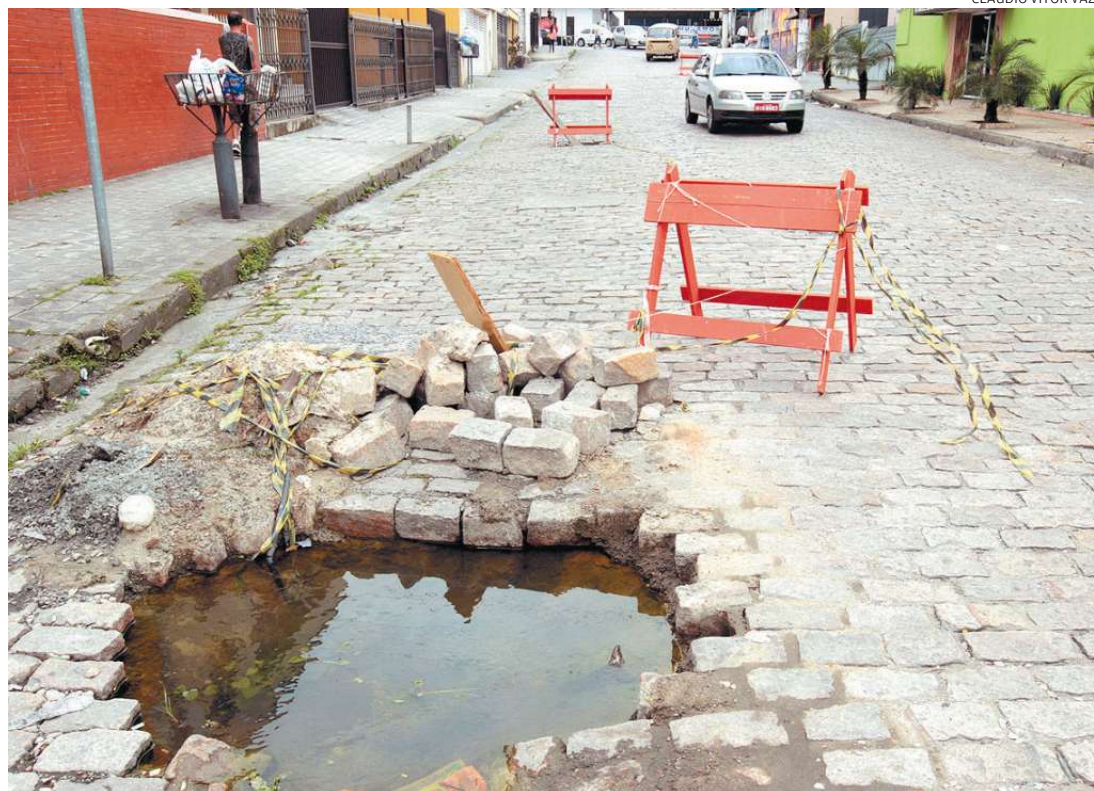
Da noite para o dia, a Rua Emílio Carlos virou protagonista do trânsito na Cidade. E paga caro por isso

rocha, cada um teria 15 metros de largura e 1.352 metros de extensão.