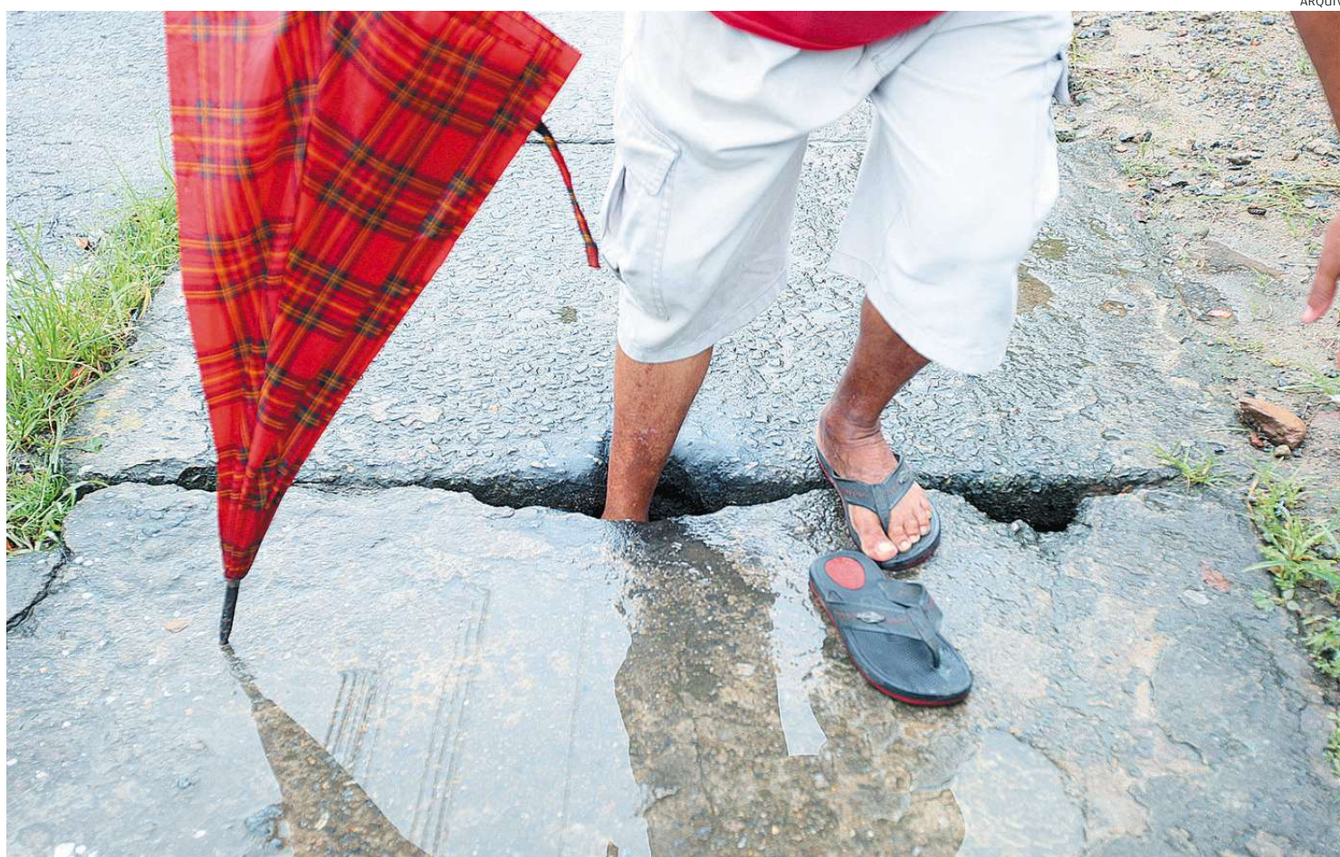
Atualmente, a conservação dos passeios públicos é feita pela Prefeitura, que irá cobrar do proprietário do imóvel os custos com a intervenção

Pelas regras atuais, cabe à Administração Municipal o conserto e a manutenção dessas áreas públicas. Caso a proposta avance no Legislativo e seja sancionada pela chefe do Executivo, os custos de reparo