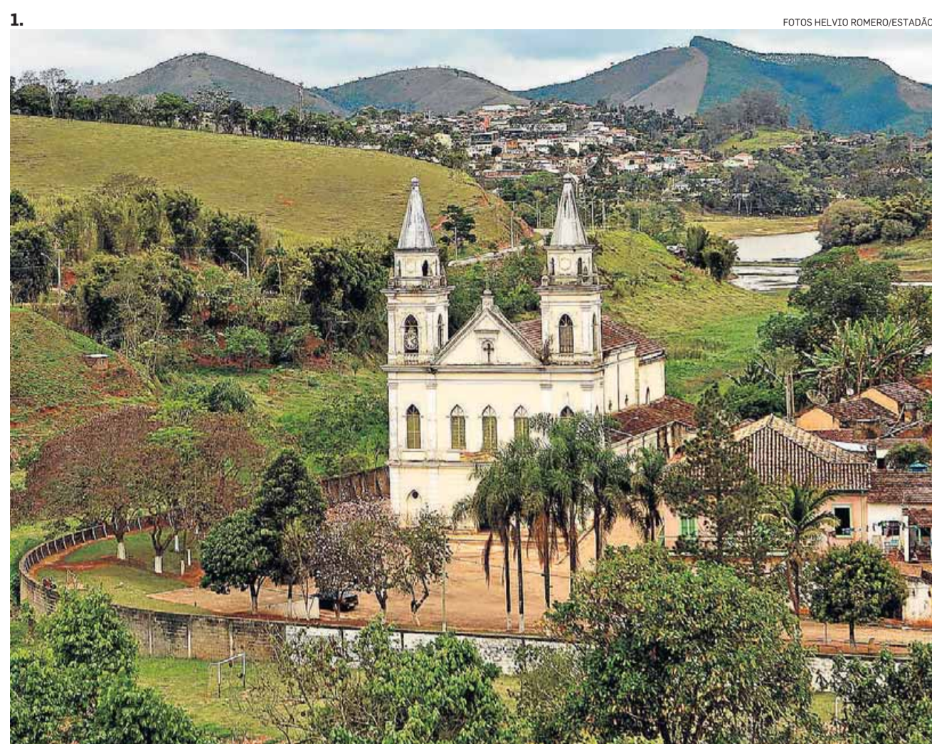
1. O passado murado. O desgaste das construções é um dos problemas a ser contornado no restauro, de R$ 15 mi