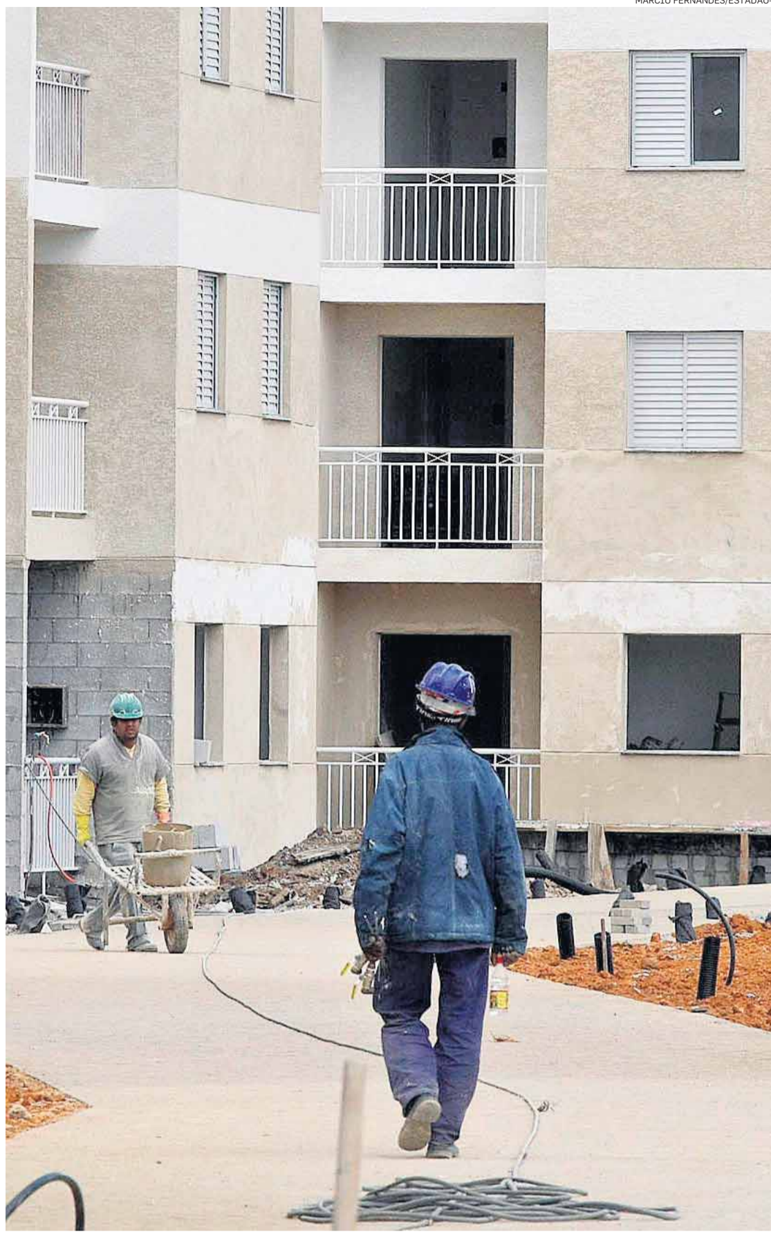
Crescimento. Medidas vão ajudar setor imobiliário e podem dar impulso ao PIB em 2014

verno elevar o limite do financiamento, mas o governo resistia. Segundo ele, havia o temor de que o teto maior provocasse uma corrida ao financiamento, com impacto negativo no saldo do FGTS. “E o fundo tem finalidade mais nobre, que é financiar a habitação de interesse social”, observou. Porém, disse ele, o governo foi convencido que a “avalanche” não ocorrerá. Além disso, houve o cuidado de adotar limites mais altos apenas onde o mercado é mais aquecido. / COLABOROU LAIS ALEGRETTI