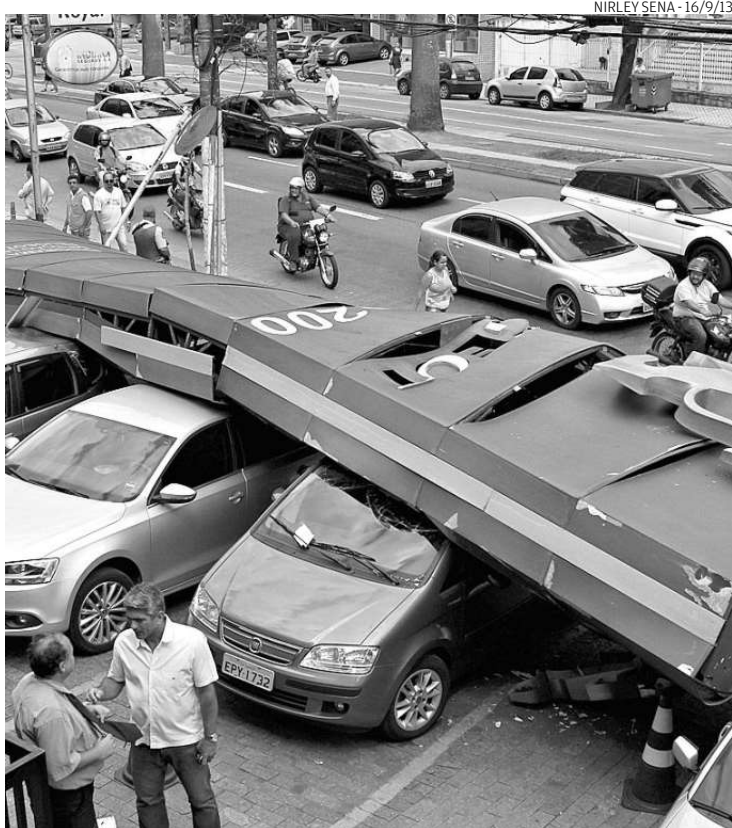
Na ocorrência mais recente, totem de concessionária tombou sobre carros