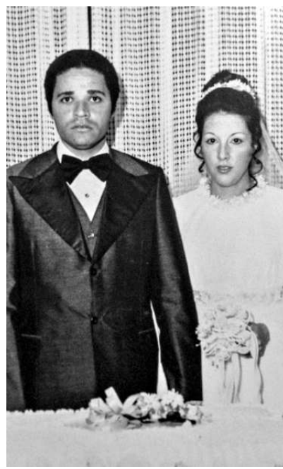
Foto do passado