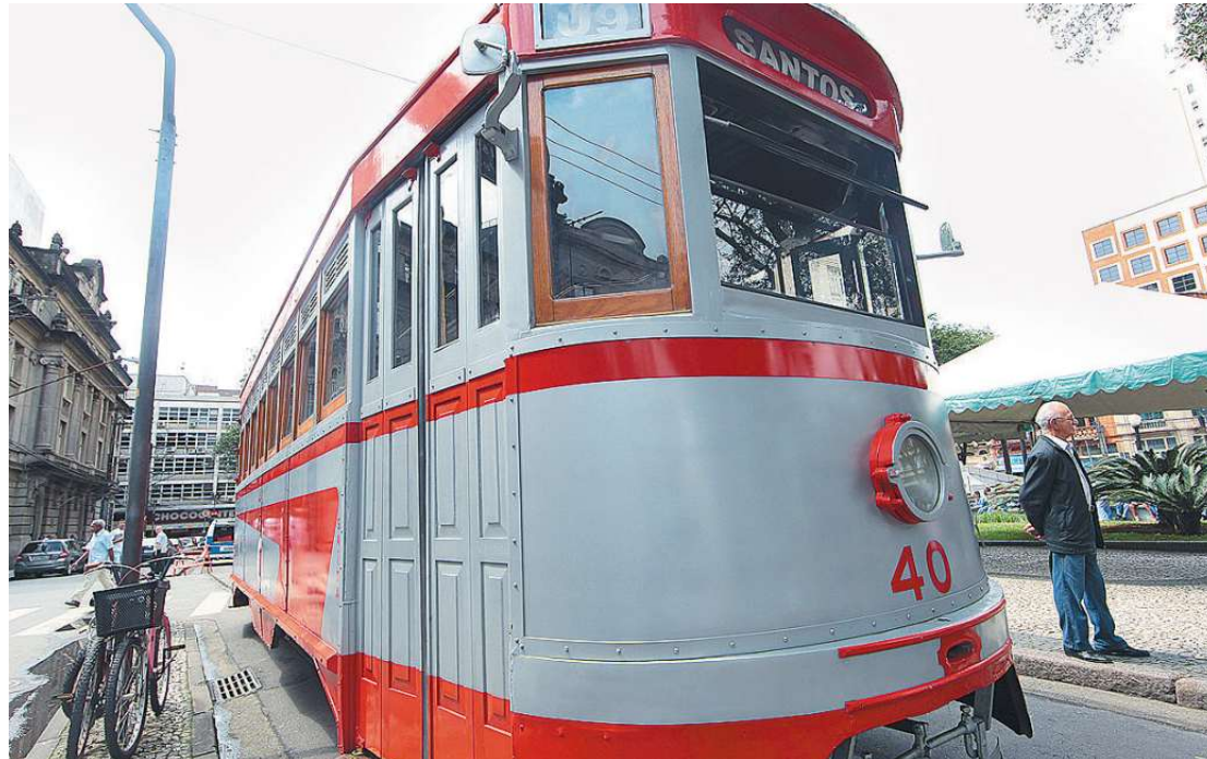
Os veículos que circulam na linha turística foram expostos ontem, durante o Dia Municipal do Bonde

Conforme o secretário de Turismo, o bilhete do bonde 3265