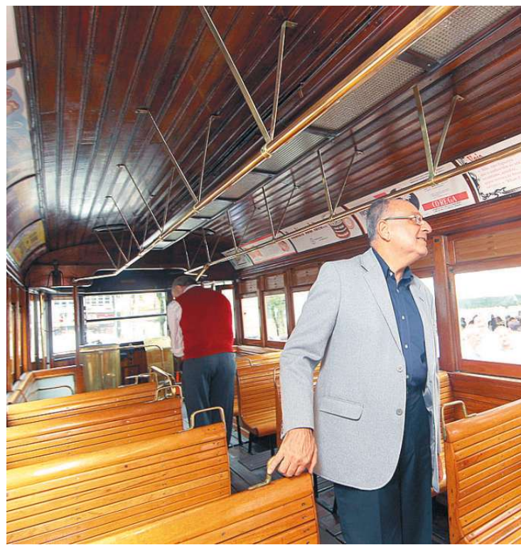
O visual retrô do bonde 40, o Camarão, é fruto do minucioso trabalho de um grupo de funcionários da CET. O veículo é escocês, datado de 1911

Origem: Modelo italiano, datado de 1958. Doado pela cidade de Turim. Início da operação: 23/9/2010.