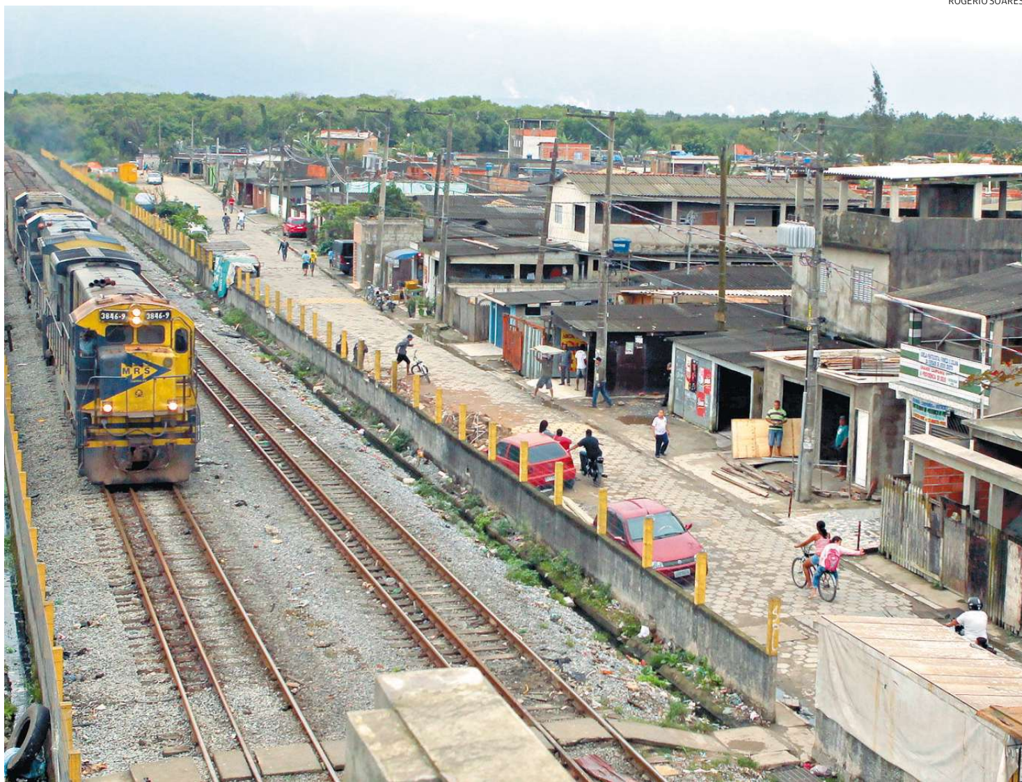
As novas 600 unidades vão beneficiar quase três mil pessoas que vivem na vila considerada a maior área de ocupação irregular do Município

De acordo com a Secretaria Municipal de Habitação, a suspensão da sessão pública se deu conforme as regras nacionais de licitação. E foi motiva-