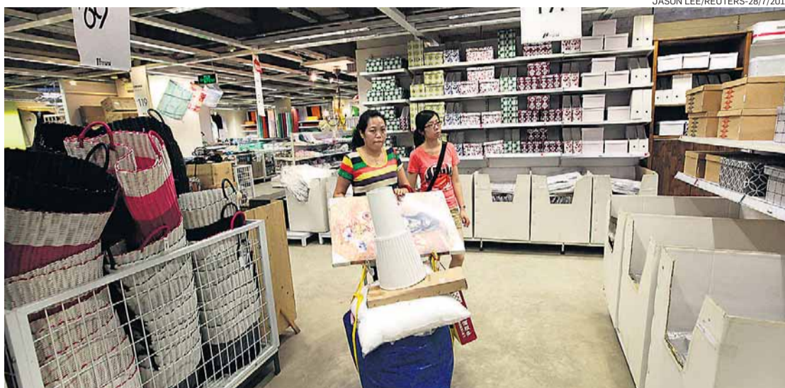
Cientes. Na China, a Ikea tem 14 lojas, sendo que a de Pequim é a mais visitada do mundo

Executivos da Ikea passaram a apostar mais fichas nos países