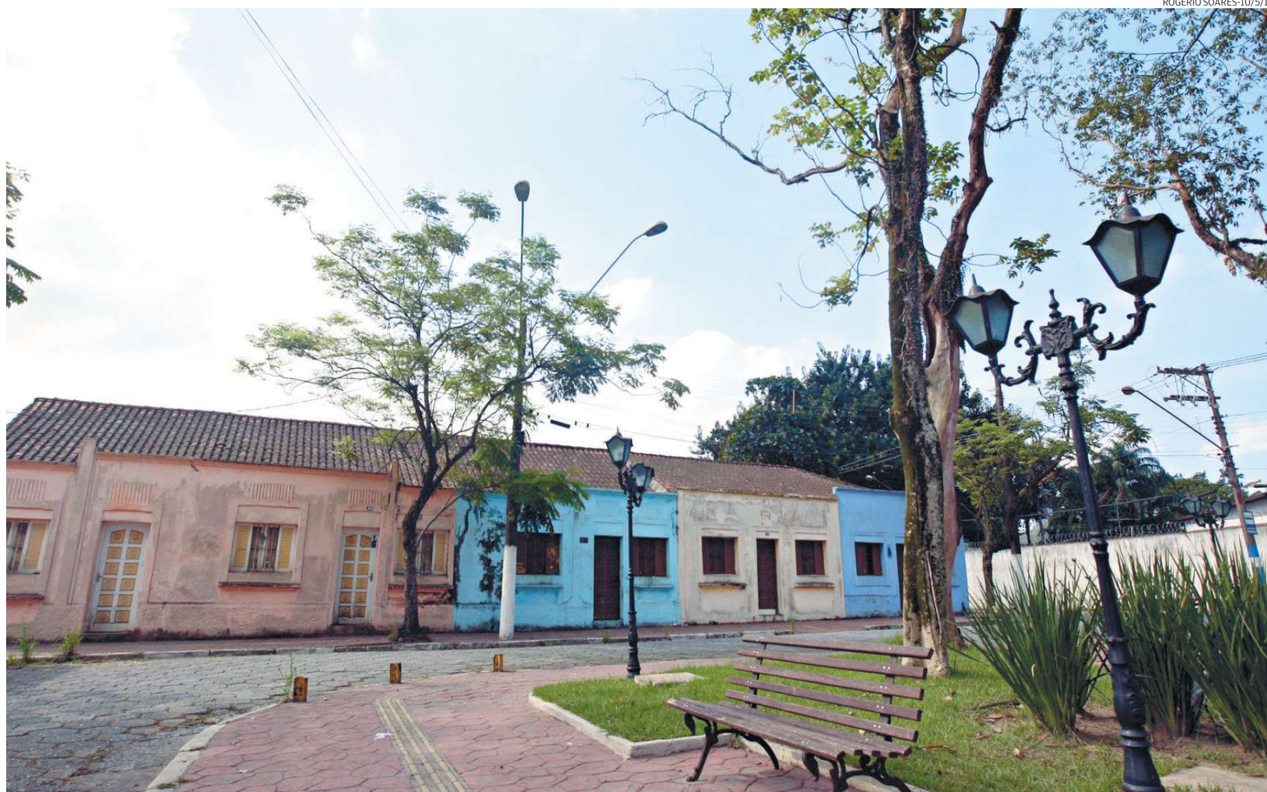
Um dos cenários preferidos para filmagens é um dos mais antigos pontos de Cubatão, o Largo do Sapo. Por sua característica arquitetônica, é um bom duplê de cidade do interior

A curta distância entre a cidade de São Paulo (maior centro