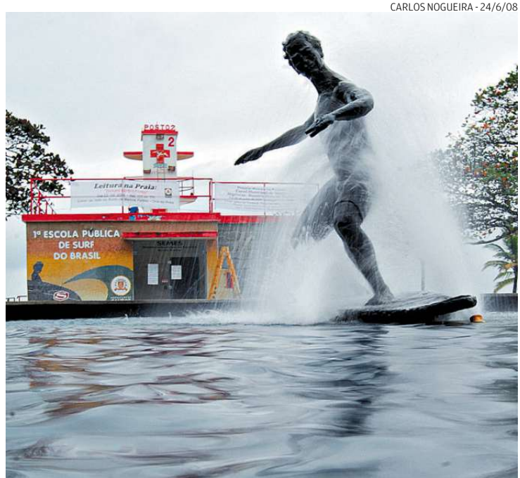
Estátua do surfista defronte ao Posto 2, na Pompéia, que será reformado

nistração criará um padrão arquitetônico, que será repetido nos demais postos. O objetivo é oferecer mais conforto para a população. No Posto 2 serão investidos em torno de R$ 250 mil. Ainda não se fizeram orçamentos para os demais prédios.