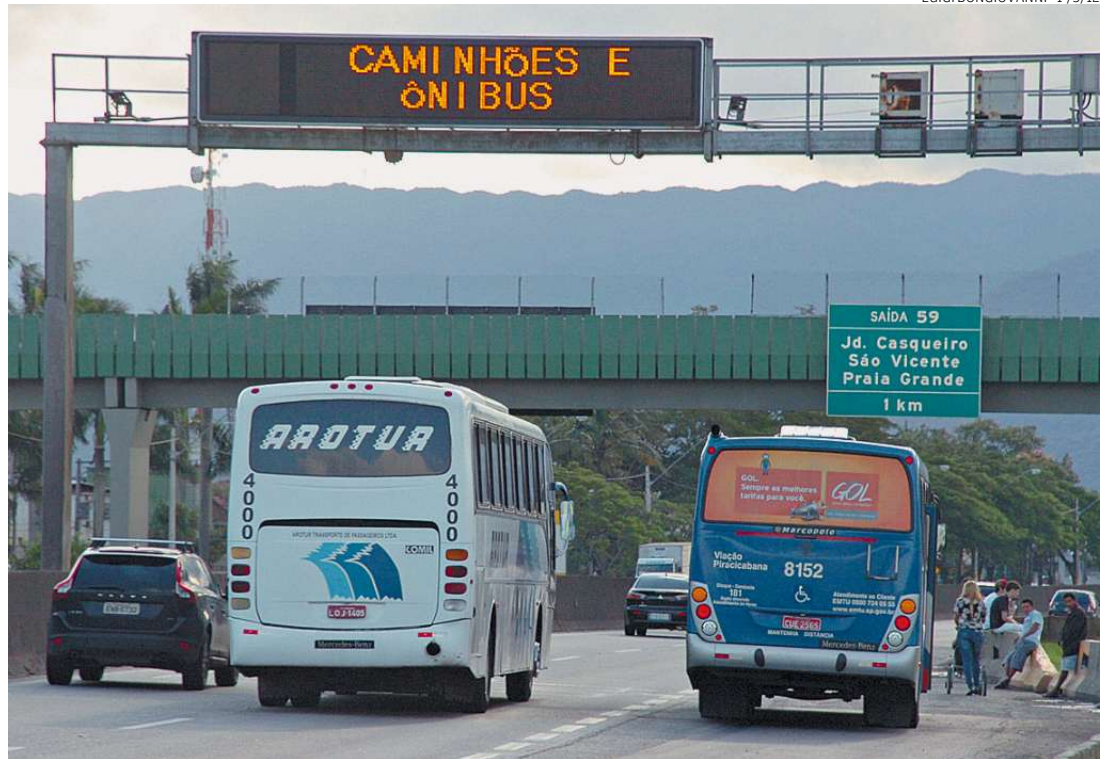
Ônibus de fretamento têm de descer a Serra do Mar pela Anchieta: passageiros querem usar Imigrantes