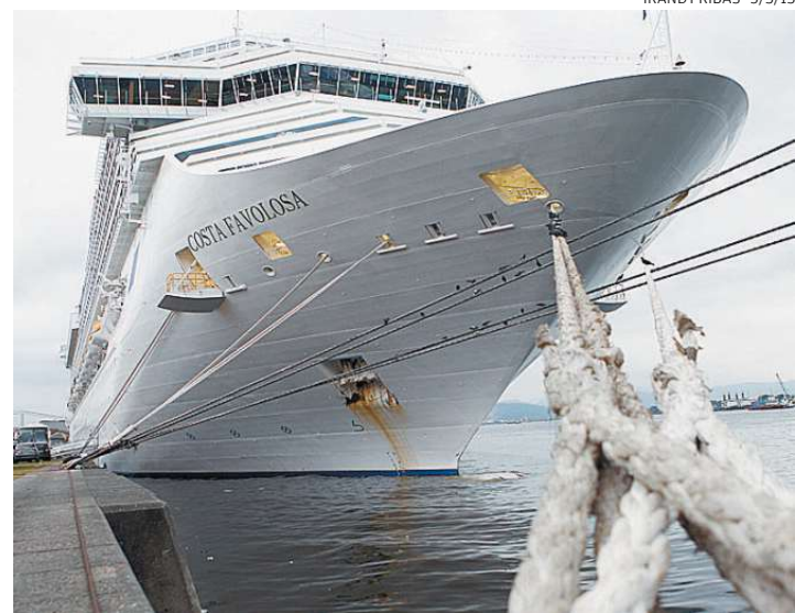
Turismo de Santos quer incluir operadoras de cruzeiros em ações

“No Goal to Brasil , são divulgados os roteiros com até 150 quilômetros ou duas horas de aéreo das 12 cidades-sede. Aí que justamente estão focados