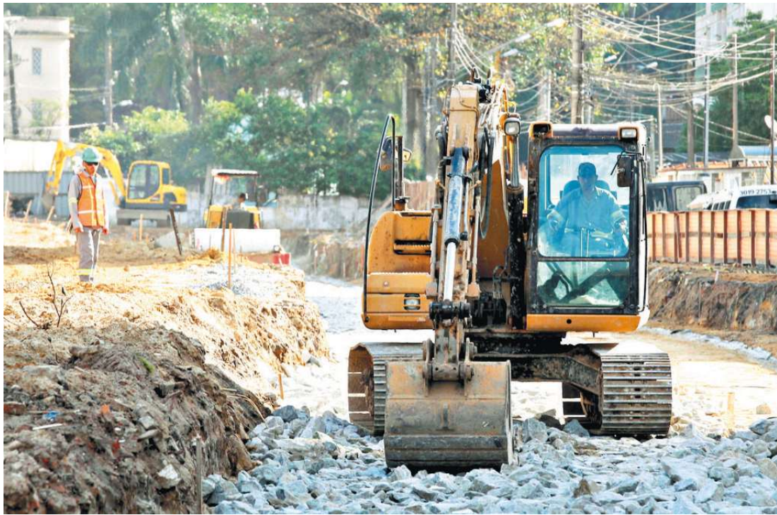
Parlamentares criticam falta de planejamento com o projeto do VLT, prometido há anos para a região

Também entende que o Legislativo deve fazer esse questionamento ao governador Geraldo Alckmin (PSDB) e aler-