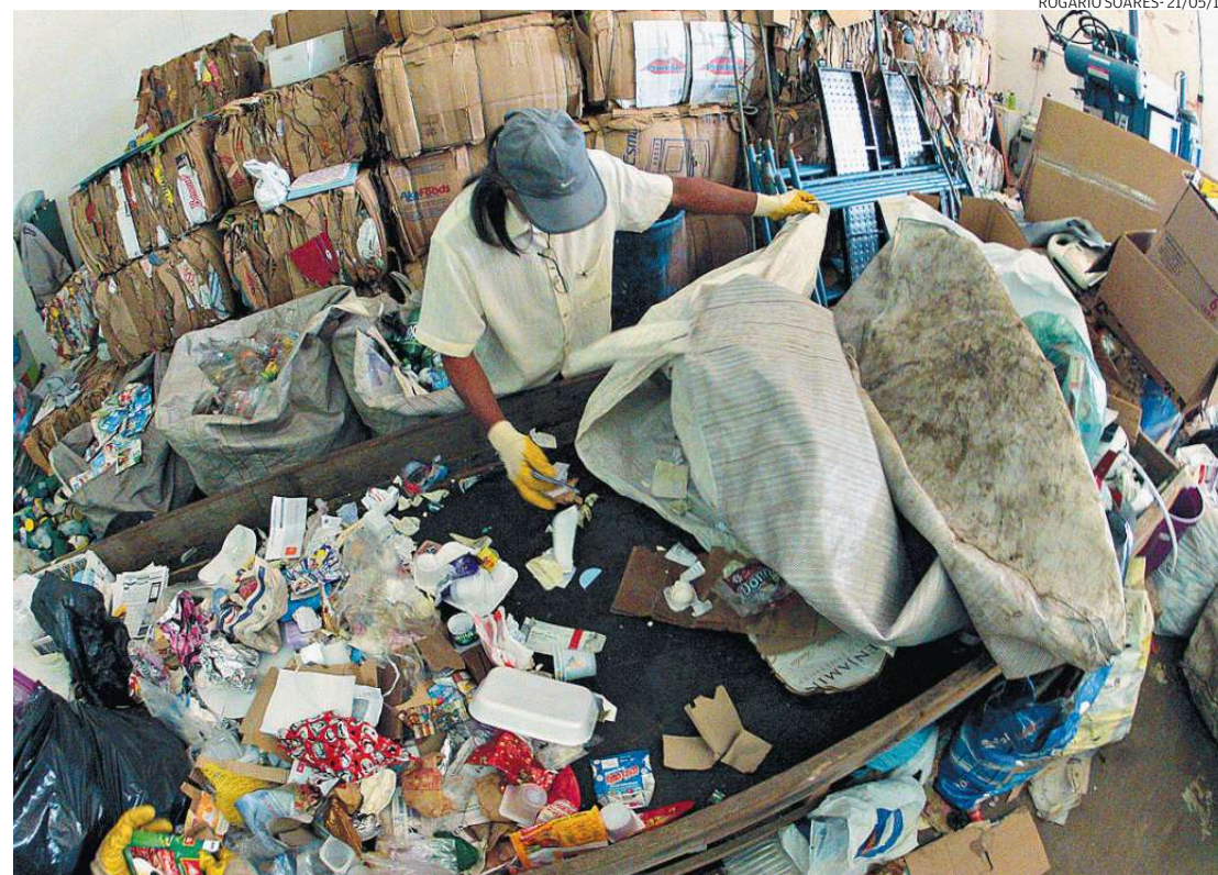
Reaproveitamento de resíduos, com coleta seletiva e reciclagem, seria uma das soluções para o problema

federal pretende transformar os hábitos de consumo de produtos, de maneira a gerar a menor quantidade possível de resíduos.