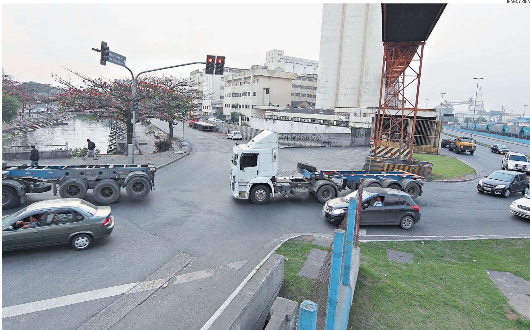
Em Santos, acesso ao túnel será pelo bairro Macuco, próximo à região portuária. Equipamento terá 762 metros de extensão e 950 de rampa, até Vicente de Carvalho, em Guarujá

O documento já foi entregue à Cetesb para que as licenças necessárias sejam emitidas e a obra possa começar no próximo ano.