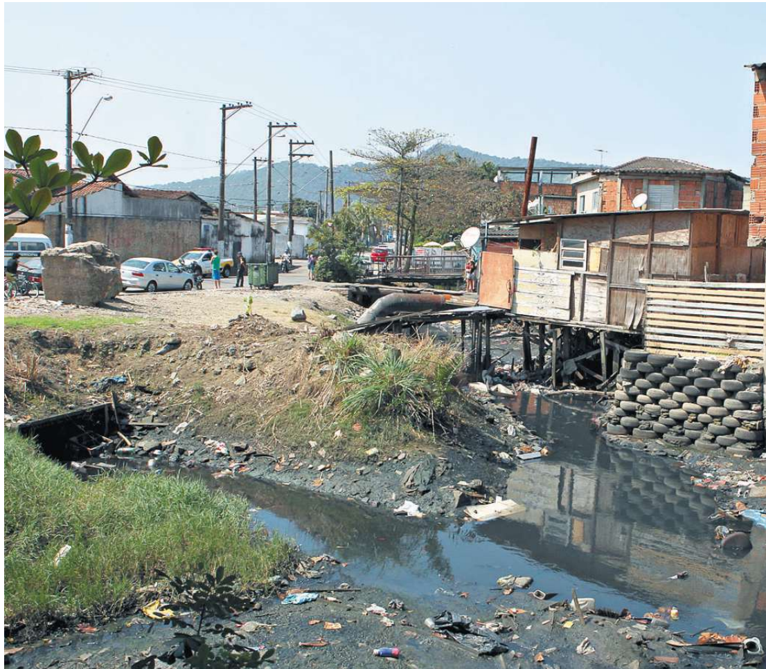
Os trabalhos tiveram início no canal da Rua Haroldo de Camargo, que faz divisa com São Vicente