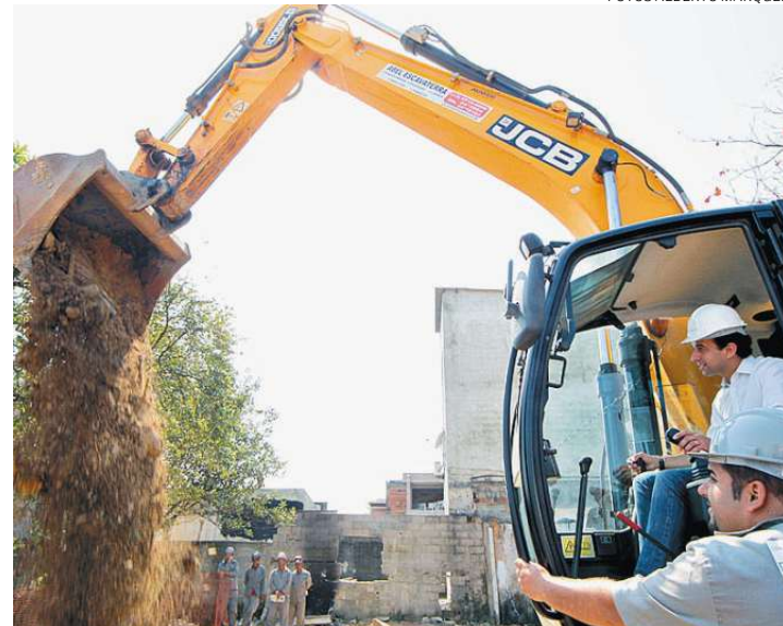
Serão 30 meses para a conclusão da primeira fase de intervenções