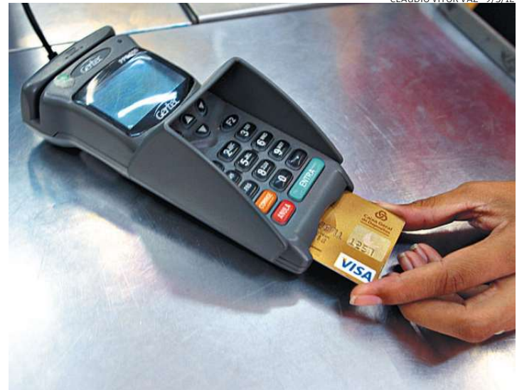
Marco prevê a proteção dos recursos envolvidos nos pagamentos

do representantes do mercado de cartões que se relacionam com as subcredenciadoras, e as próprias facilitadoras.