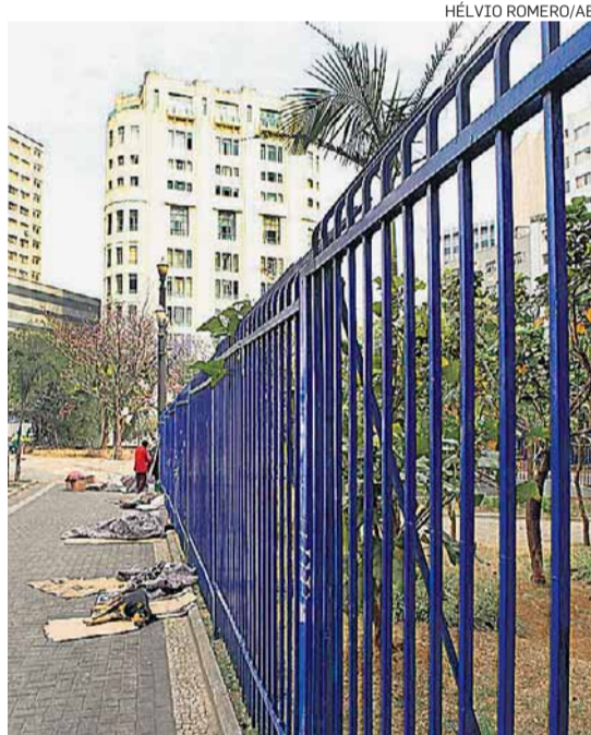
Largo de São Francisco. Área de saída de ventilação tapada; Metrô defende cercado