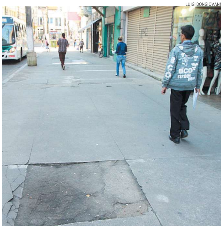
No Centro, má conservação e obras deixam seus vestígios no piso