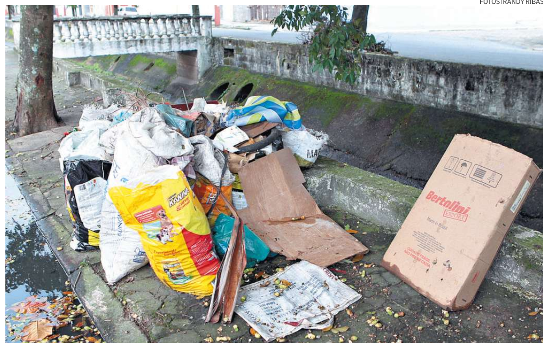
A árvore à beira do canal na Rua Monteiro Lobato não tem nenhuma lixeira. Mesmo assim, o resultado é o da foto