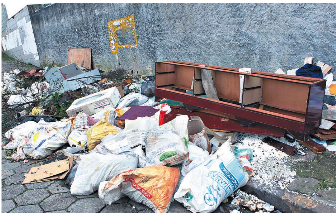
Na Rua Prefeito José Monteiro, até uma antiga cômoda é encontrada em meio aos sacos e aos restos