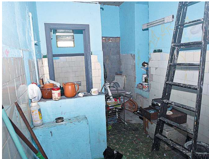
Dos quatro banheiros no prédio, dois estão praticamente inutilizáveis