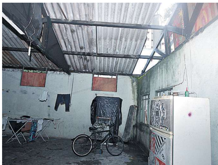
O galpão, depois de reformado, será um salão de festas e de oficinas