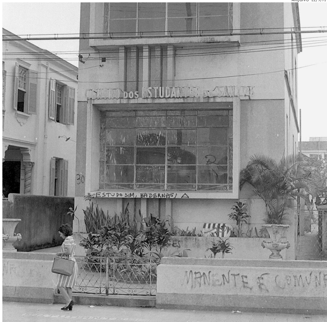
A fachada do Centro em 1971, em plena ditadura, quando o prédio fora confiscado pelo governo militar