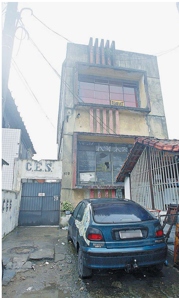
As condições precárias da sede destoam dos prédios da vizinhança

Aos 25 anos, ela crê na revitalização de uma entidade octogenária, para ser "um reduto cultural de resistência e de