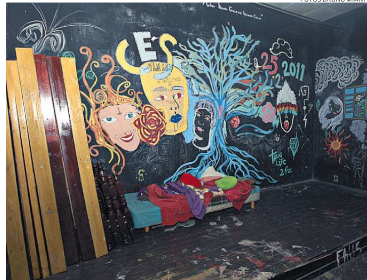
Segundo andar: planos de transformar em uma sala de shows e debates