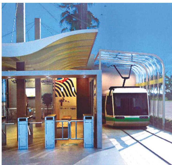
Governo do Estado mostrou como ficará uma estação após as obras

Com previsão de entrega para junho de 2014, o primeiro trecho do trajeto do VLT terá 9,5 quilômetros e 14 estações de embarque e desembarque, além do Terminal Barreiros, em São Vicente, e a Estação de Transferência Conselheiro Nébias, em Santos. O veículo irá ligar o Canal dos Barreiros até a Avenida Conselheiro Nébias, em Santos.