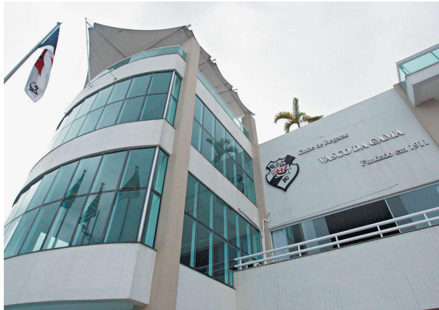
O Clube de Regatas Vasco da Gama se transformou em um clube autossustentável. O segredo é não depender apenas da contribuição social