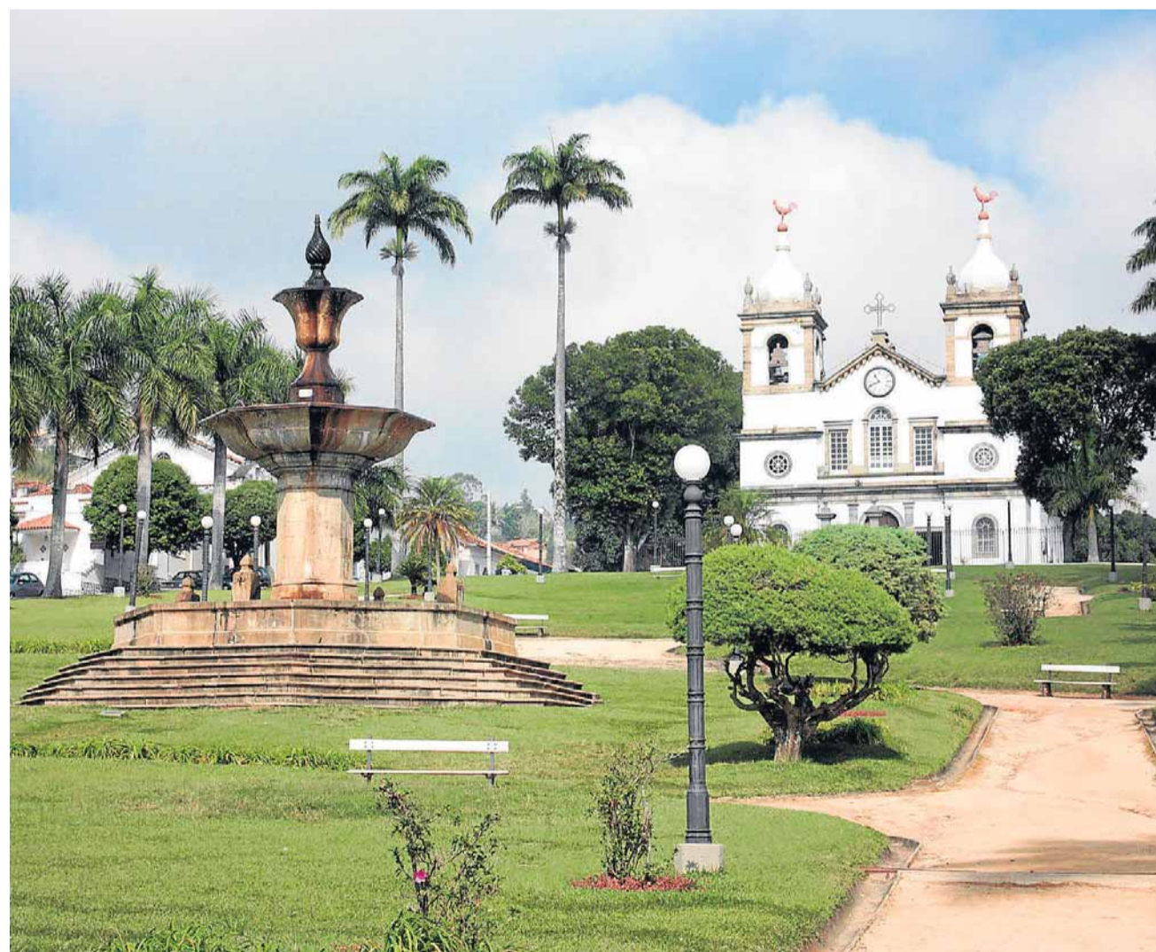
Ponto de encontro. Praça e igreja de Vassouras