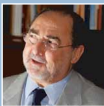
Andrea Calabi Secretário da Fazenda do Estado de São Paulo