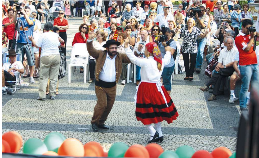
Das danças típicas de Portugal aos tentadores doces, as tradições da ‘terrinhã’ estarão em destaque

O evento, que fará alusão ao Dia de Portugal, Dia de Camões e Dia das Comunidades Portuguesas, pretende resgatar as raízes dos cidadãos e descendentes da ‘terrinhã’, além de valorizar Santos como