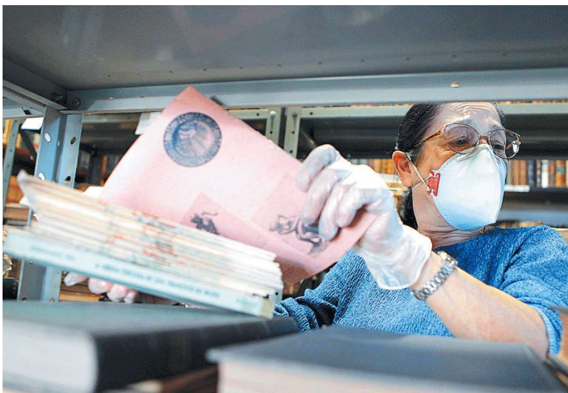
Raridades como livros, cartas e até uma cópia do Hino Nacional merecem cuidados especiais no manuseio