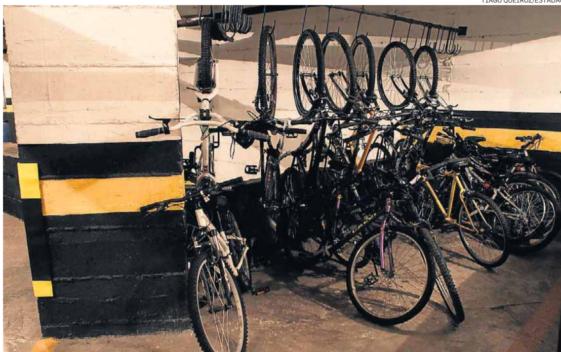
Garagem. Ativistas aprovam norma, mas lamentam que só edifício novo tenha sido incluído

As únicas exceções dispensadas de obedecer à nova obrigação são as que não têm estacionamento e estão em ruas on-