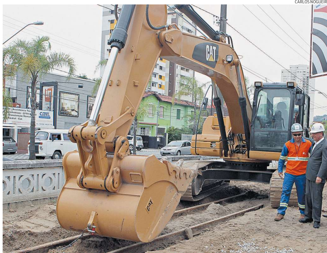
Um dos trechos da obra fica na Avenida Rodrigues Alves, entre o Canal 3 e a Avenida Conselheiro Nébias

E se a execução da obra chamará a atenção pela movimen-