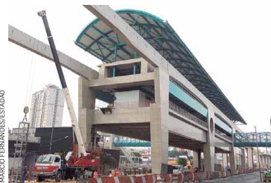
Estrutura da estação deve receber paredes de vidro a partir do próximo mês