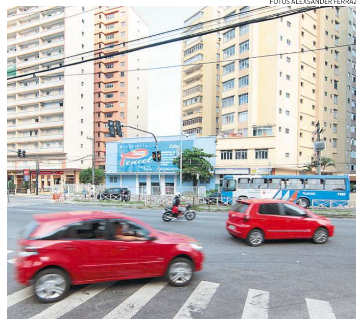
Com a remoção da ciclovia no canteiro central, a pista ganha mais espaço

expressa importante e vamos fazer todo esforço para tentar minimizar o impacto no trânsito. Alguns serviços serão feitos de dia, mas aquilo que a gente puder priorizar fora dos horários de pico será feito assim. Até mesmo à noite”.